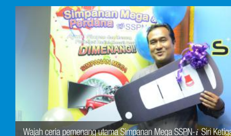
Wajah ceria pemenang utama Simpanan Mega SSPN- i Siri Ketiga