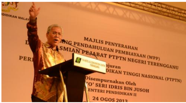
YB Menteri Pendidikan II menyampaikan ucapan perasmian.