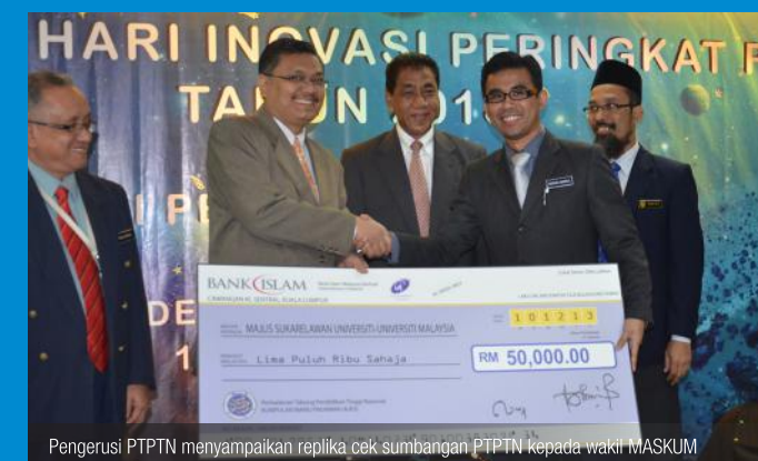
Pengerusi PTPTN menyampaikan replika cek sumbangan PTPTN kepada wakil MASKUM.

Sumbangan telah disampaikan pada 10 Disember 2013 bersempena dengan Majlis Sambutan Hari Inovasi Peringkat