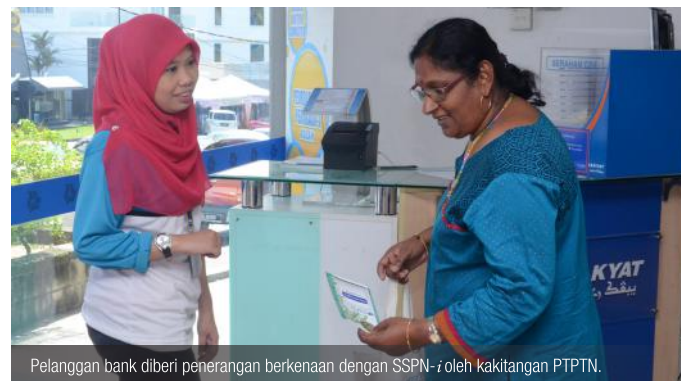
Pelanggan bank diberi penerangan berkenaan dengan SSPN-i oleh kakitangan PTPTN.

PTPTN telah 'berkampung' selama dua hari di 142 cawangan Bank Rakyat di seluruh Malaysia bagi menjayakan promosi berimpak besar ini. Promosi ini telah diadakan pada 26 dan 27 November 2013 dengan kerjasama yang sangat baik daripada pihak Bank Rakyat. Impak daripada promosi ini, sebanyak 2,241 akaun SSPN-i telah didaftarkan dengan kutipan deposit berjumlah RM501,669.39. Manakala penambahan akaun SSPN-i sebanyak 843 dengan jumlah kutipan RM363,081.95 menjadikan keseluruhan transaksi adalah sebanyak 3,084 bernilai RM864,751.34.