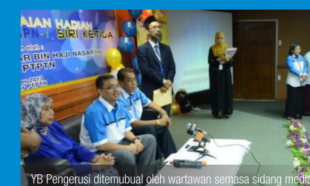
YB Pengerusi ditemubual oleh wartawan semasa sidang media