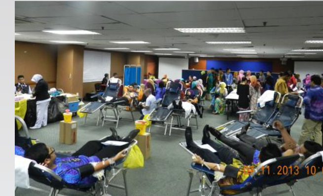
Sambutan yang diterima daripada warga PTPTN amat menggalakkan.

Penilaian ini dilaksanakan dengan kolaborasi antara MDeC, MAMPU dan Biro Pengaduan Awam bagi memastikan kemampanan dan integriti portal atau laman web. Hasil daripada kejayaan dan pengiktirafan laman sesawang PTPTN yang telah diperolehi, diharapkan akan menguatkan lagi iltizam warga PTPTN yang terlibat bagi memperkasakan inovasi dan kreativiti dalam akses laman sesawang.