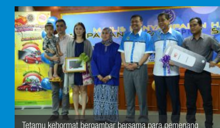
Tetamu kehormat bergambar bersama para pemenang