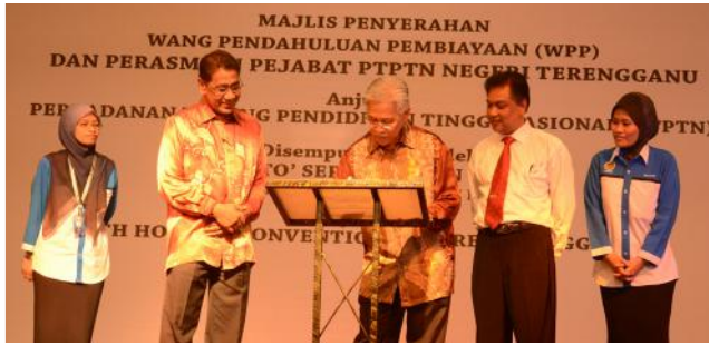
YB Menteri Pendidikan II menandatangani plak pelancaran Pejabat PTPTN Negeri Terengganu.