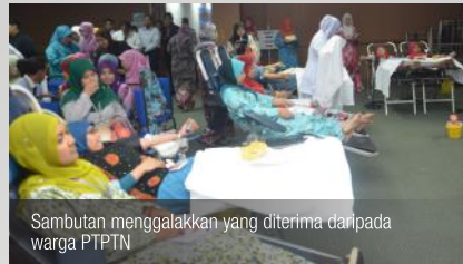
Sambutan menggalakkan yang diterima daripada warga PTPTN