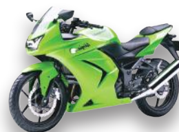
HADIAH KETIGA Kawasaki Ninja