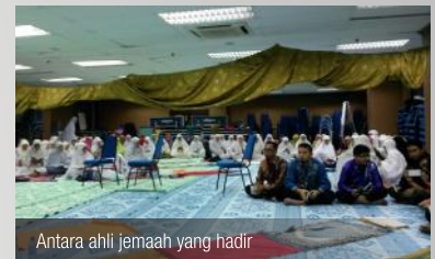
Antara ahli jemaah yang hadir