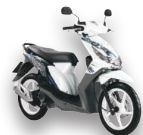
SAGUHATI x30 Honda Icon