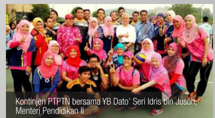
Kontinjen PTPTN bersama YB Dato' Seri Idris bin Jusoh, Menteri Pendidikan II

PTPTN telah menyertai Sukan Mini YB Menteri Pendidikan II pada 25 Jun 2014 bertempat di Kementerian Pendidikan Malaysia, Putrajaya. Antara sukan yang telah dipertandingkan adalah bola tampar (lelaki/ wanita), bola jaring, petanque dan