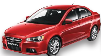
HADIAH PERTAMA Proton Inspira

Tempoh promosi bagi Simpanan Perdana SSPN- i bermula daripada 1 Januari 2013 dan berakhir pada 30 September 2013 manakala tempoh pengekalan deposit adalah daripada 1 Oktober 2013 sehingga 31 Disember 2013. Pelbagai hadiah menarik ditawarkan.