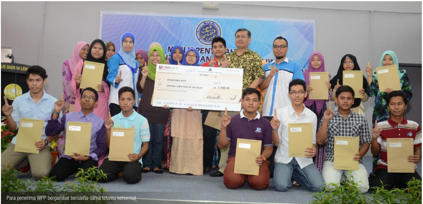
Para penerima WPP bergambar bersama-sama tetamu kehormat