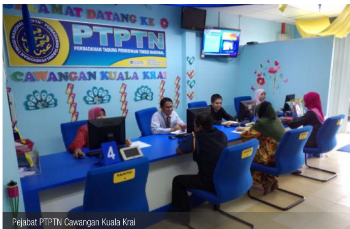
Pejabat PTPTN Cawangan Kuala Krai

telah mempunyai 23 buah PPN/ PPC yang beroperasi di seluruh Malaysia. Informasi lanjut berkenaan Pejabat PTPTN di seluruh Malaysia layari www.ptptn.gov.my .