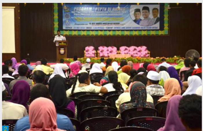
1 Sesi penyampaian WPP kepada penerima.