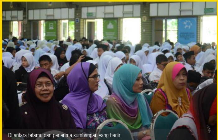
Di antara tetamu dan penerima sumbangan yang hadir