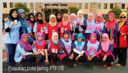
Pasukan bola jaring PTPTN