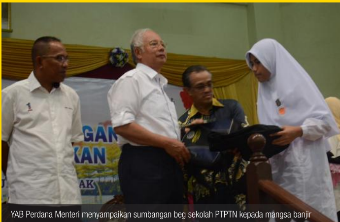
YAB Perdana Menteri menyampaikan sumbangan beg sekolah PTPTN kepada mangsa banjir

Misi Sukarelawan PTPTN telah memberikan sumbangan beg sekolah bernilai RM100,000.00 untuk diagihkan kepada 1,900 buah keluarga mangsa banjir bertujuan untuk meringankan beban ibu bapa yang mempunyai anak-anak yang akan memulakan sesi persekolahan pada awal tahun 2014.