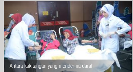
Antara kakitangan yang menderma darah

Program Derma Darah Peringkat PTPTN anjuran Biro Kebajikan dan Kesihatan, Kelab Sukan dan Kebajikan (KSK) PTPTN telah diadakan pada 5 Mac 2014 bertempat di Dewan Besar PTPTN. Seramai 141 pegawai daripada Ibu Pejabat PTPTN dan