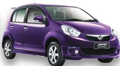
HADIAH KEDUA Perodua Myvi