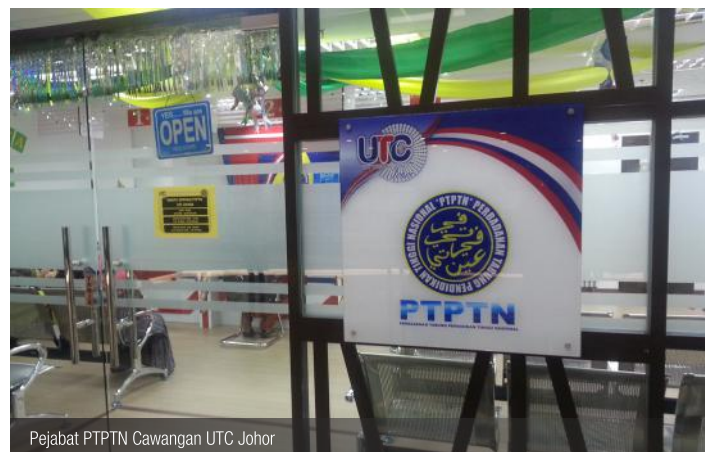
Pejabat PTPTN Cawangan UTC Johor