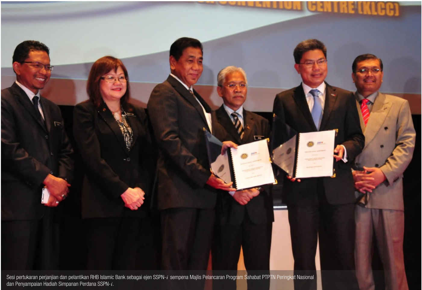
Sesi pertukaran perjanjian dan pelantikan RHB Islamic Bank sebagai ejen SSPN- i sempena Majlis Pelancaran Program Sahabat PTPTN Peringkat Nasional dan Penyampaian Hadiah Simpanan Perdana SSPN- i .

Diharapkan dengan pelantikan RHB Islamic Bank sebagai ejen SSPN- i dapat memudahkan dan menggalakkan lebih ramai rakyat Malaysia untuk membuka akaun dan membuat penambahan deposit di dalam SSPN- i .