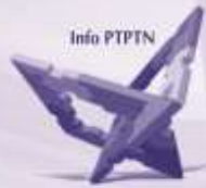
Jadual 12 : Syarat Dan Kaedah Kelulusan Pegecualian Bayaran Balik Pembiayaan Pendidikan PTPTN